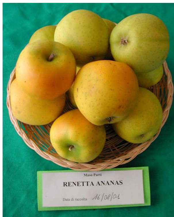
Figura 11: Frutti maturi in mostra – clone B