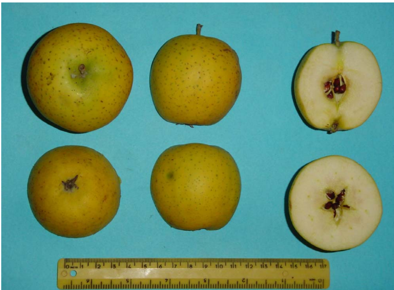
Figura 8: Frutti in sezione – clone A