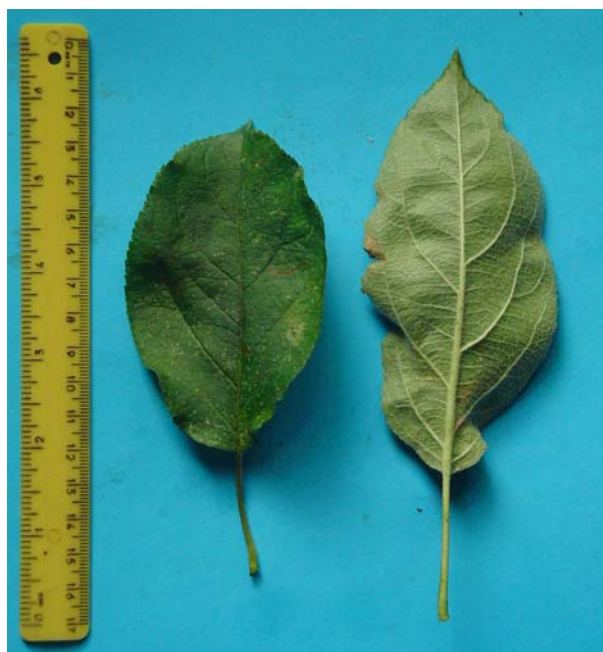
Figura 6: Foglie lamburde – clone A