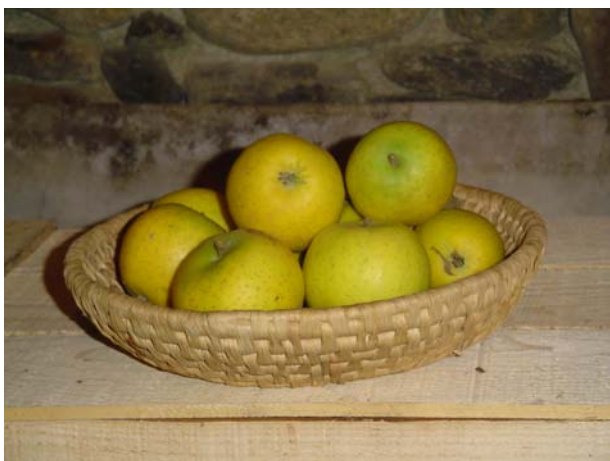
Figura 12: Frutti maturi in mostra – clone A