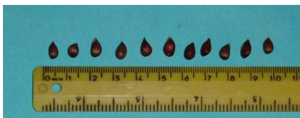
Figura 10: Semi – clone A