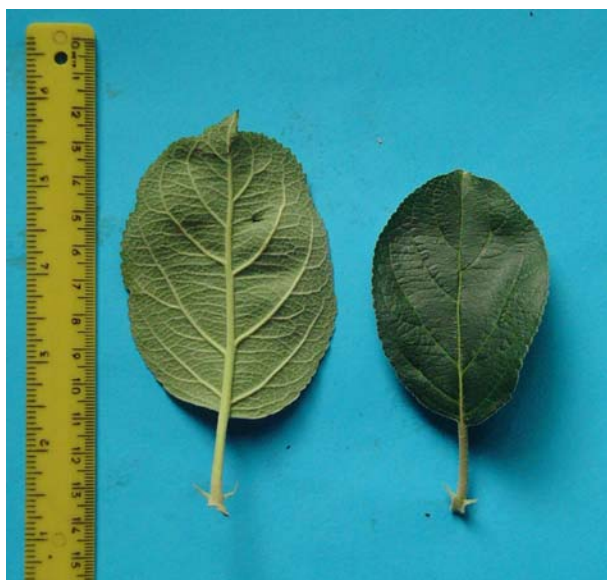
Figura 5: Foglie rami di un anno – clone A