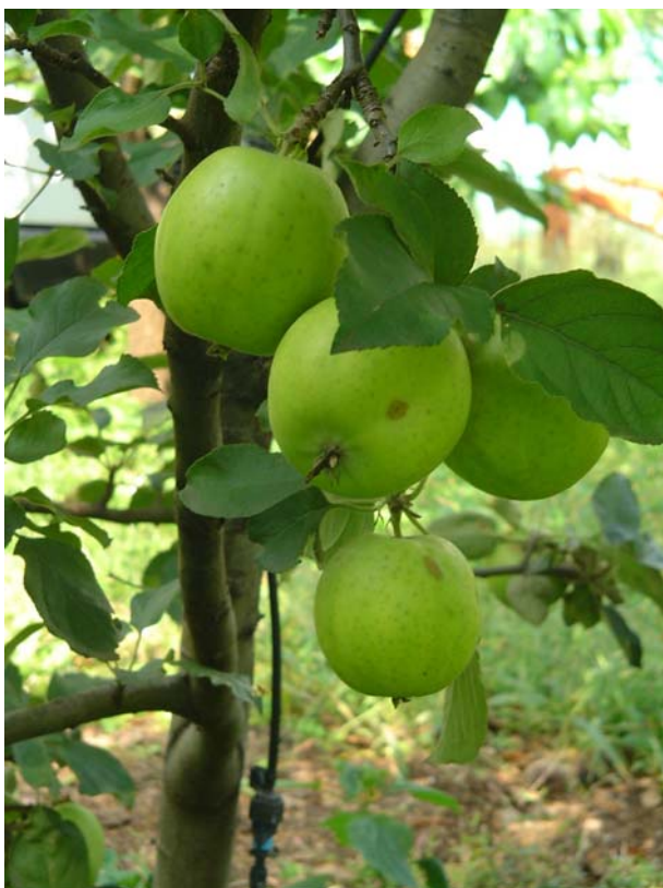
Figura 7: Frutti su pianta – clone A