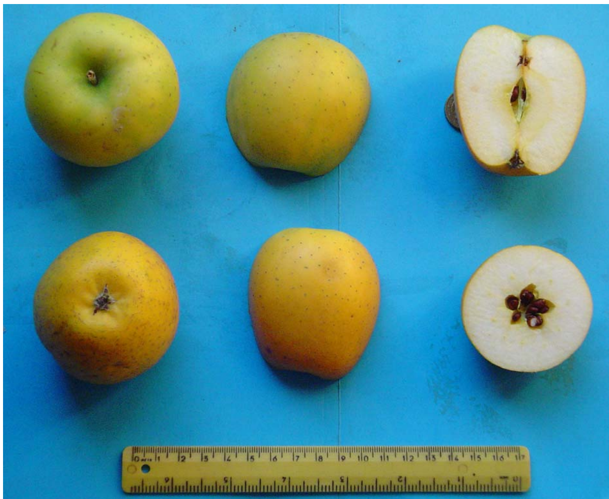
Figura 9: Frutti in sezione – clone B