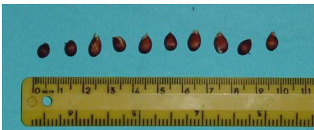
Figura 9: Semi