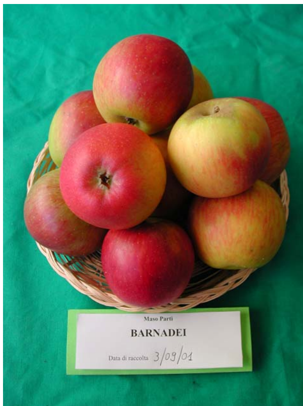
Figura 10: Frutti maturi in mostra