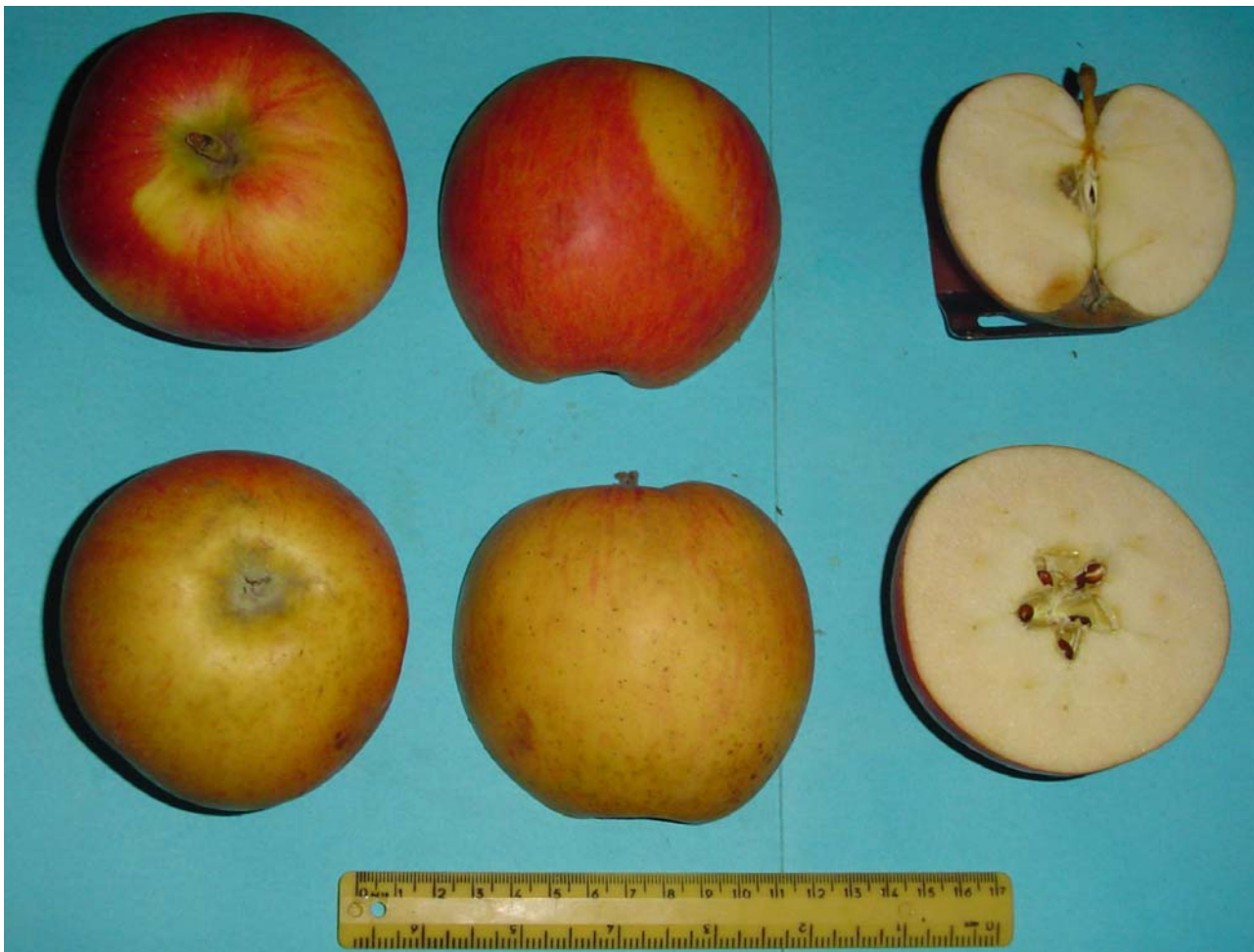
Figura 8: Frutti in sezione