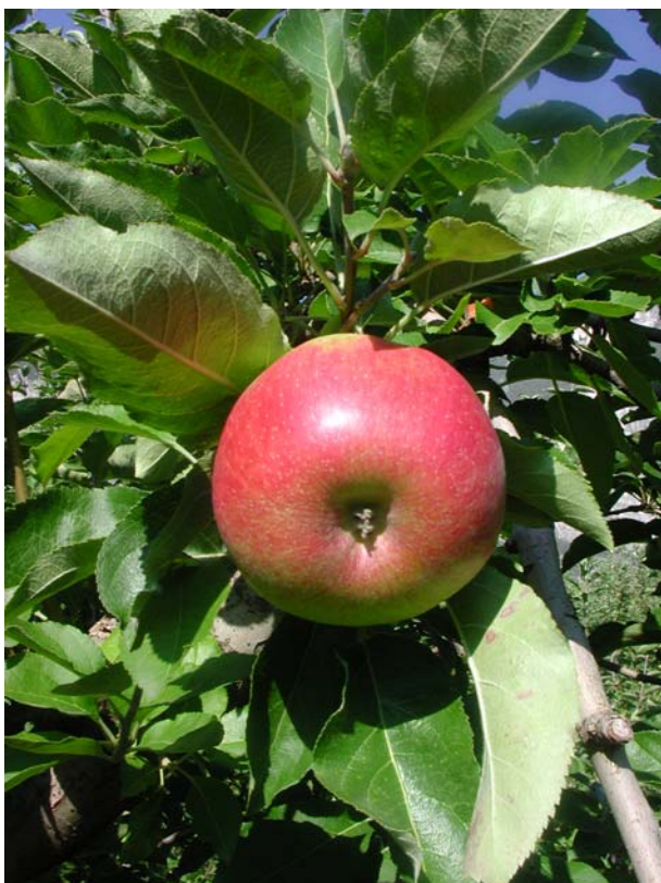
Figura 7: Frutti su pianta